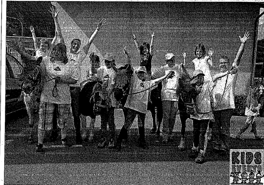
Das Ponyreiten im Wiggispark – ein voller Erfolg.

Nach dem erfolgreichen Ponyreiten um den Wiggispark steigt beim Kids-Event im Juni das nächste Highlight. Ab Dienstag, 14., bis Samstag, 18. Juni, präsentiert sich die Mall in stilvollem Sommer-Outfit und stimmt die Kundschaft auf «die schönsten Tage im Jahr» ein.